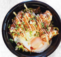
目玉焼きのせ 唐揚げ丼 500円