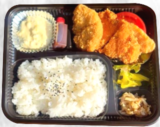
ミックスフライ弁当 ヒレカツ、チキンカツ アジフライ 550円