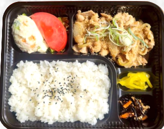
豚バラネギ塩弁当 500円