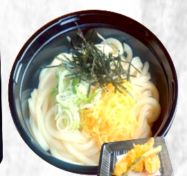
ぶっかけうどん 天ぷら付 500円