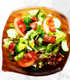
シーザーサラダ シーザードレ 480円