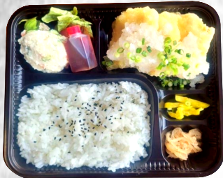
鶏天おろしポン酢 弁当 500円