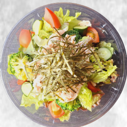
鶏海苔サラダ 玉ねぎドレ 480円