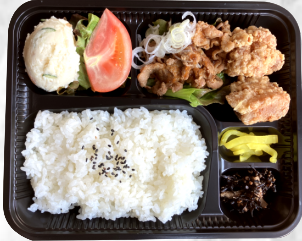
牛カルビと唐揚げの コンビ弁当 600円