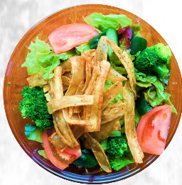
ゴボウサラダ 玉ねぎドレ 480円