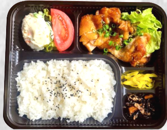
鶏の山賊焼弁当 500円